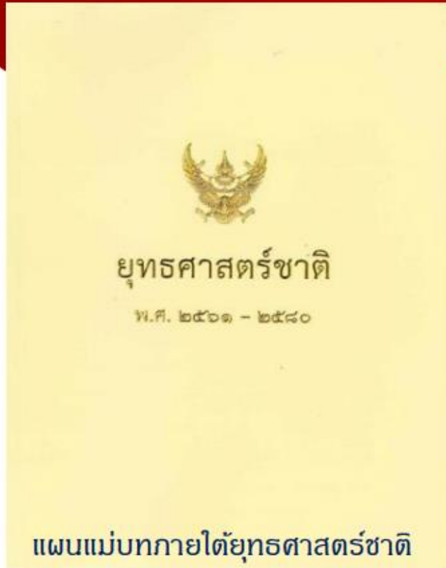
ประเด็น การต่อต้านการทุจริตและประพฤติมิชอบ (พ.ศ. 2561 - 2580)